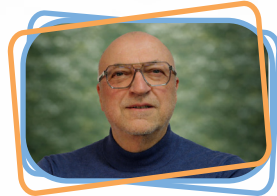
Billard Henri Retraité